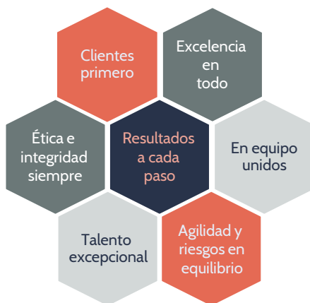
Figura 1. Principios Corporativos de Credicorp Capital

Como inversionista responsable, Credicorp Capital Asset Management reconoce la importancia de la propiedad activa como componente central de su deber fiduciario. Creemos que, al involucrarnos con las compañías en las que invertimos, tenemos la oportunidad de abordar asuntos económicos y de ASG materiales en la generación de valor sostenible de largo plazo para nuestros clientes y la sociedad. Nuestras actividades de