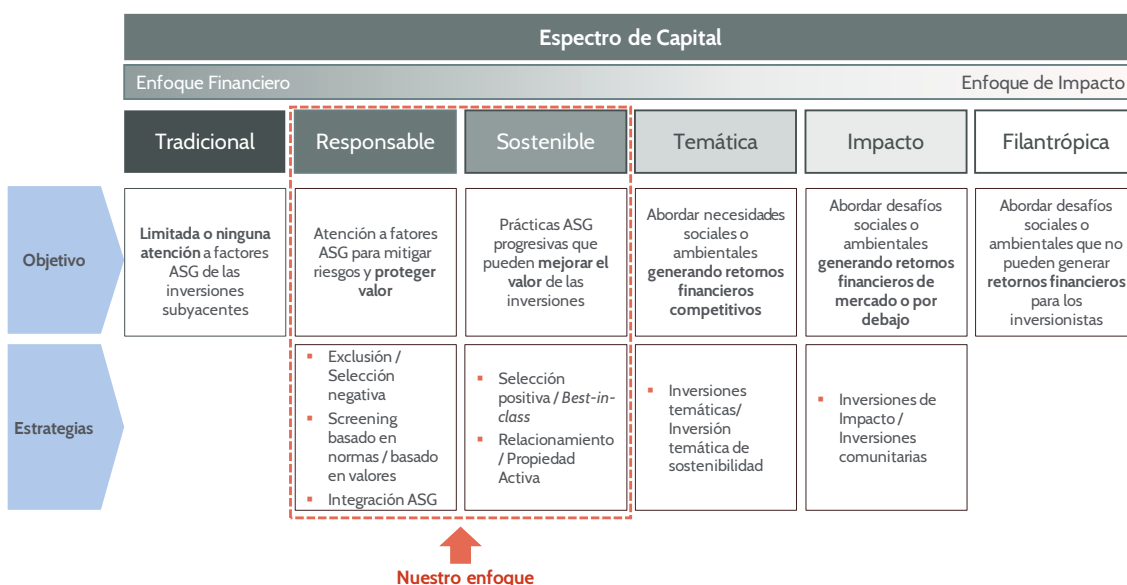
Figura 2. Estrategias de Inversiones Sostenibles y Responsables