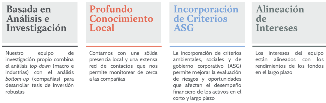
Figura 3. Filosofía de Inversión de Credicorp Capital Asset Management

En Credicorp Capital Asset Management, la integración de criterios ASG se lleva a cabo a través de todo el proceso de decisión de inversión, incluido el análisis de alternativas, la construcción de portafolios y asignación.